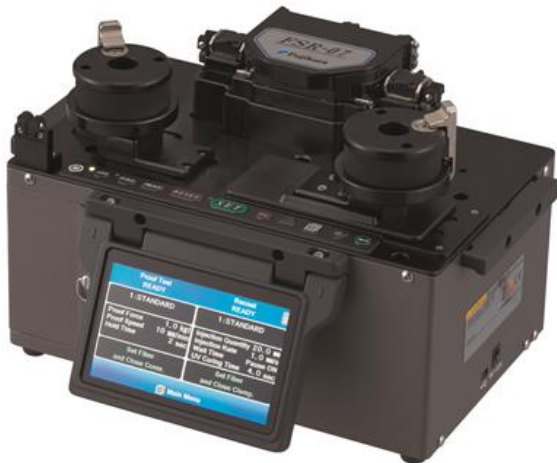
藤仓 FSR-07 涂覆机(带 10N 拉力测试)