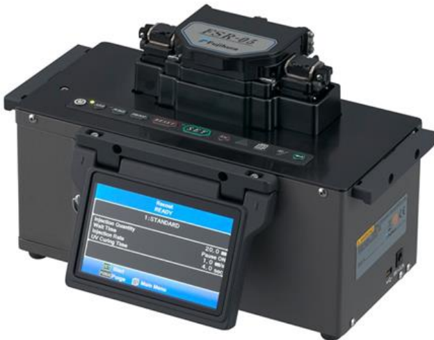
藤仓 FSR-05 涂覆机

购买任意一台藤仓 FSR-05/06/07 光纤涂覆机, 可享 活动时间: 2018 年 1 月 1 日 ~ 12 月 31 日