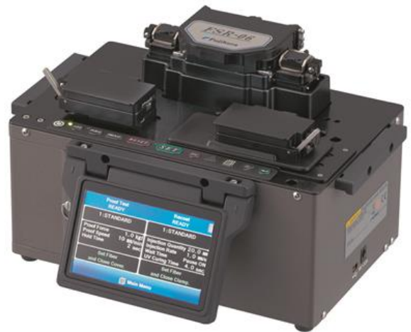
藤仓 FSR-06 涂覆机(带 2N 拉力测试)